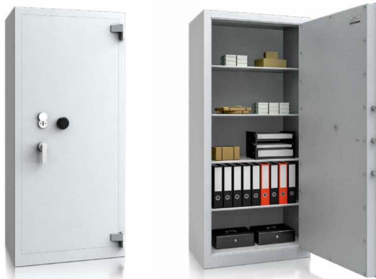
Modell SG I VS 2