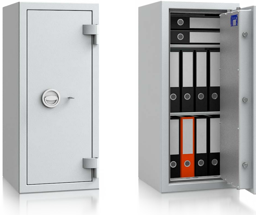
Modell GA 95