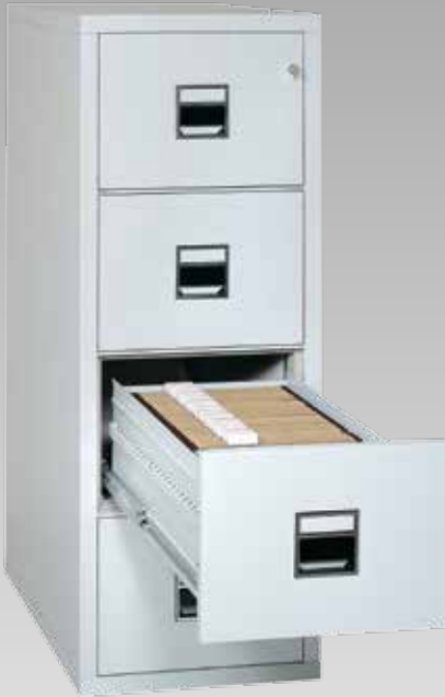
Abb.: KT 4 V