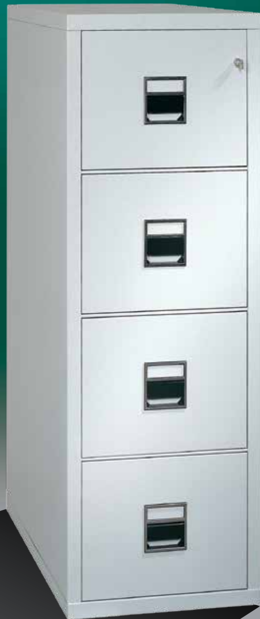
Abb.: KT 4 V