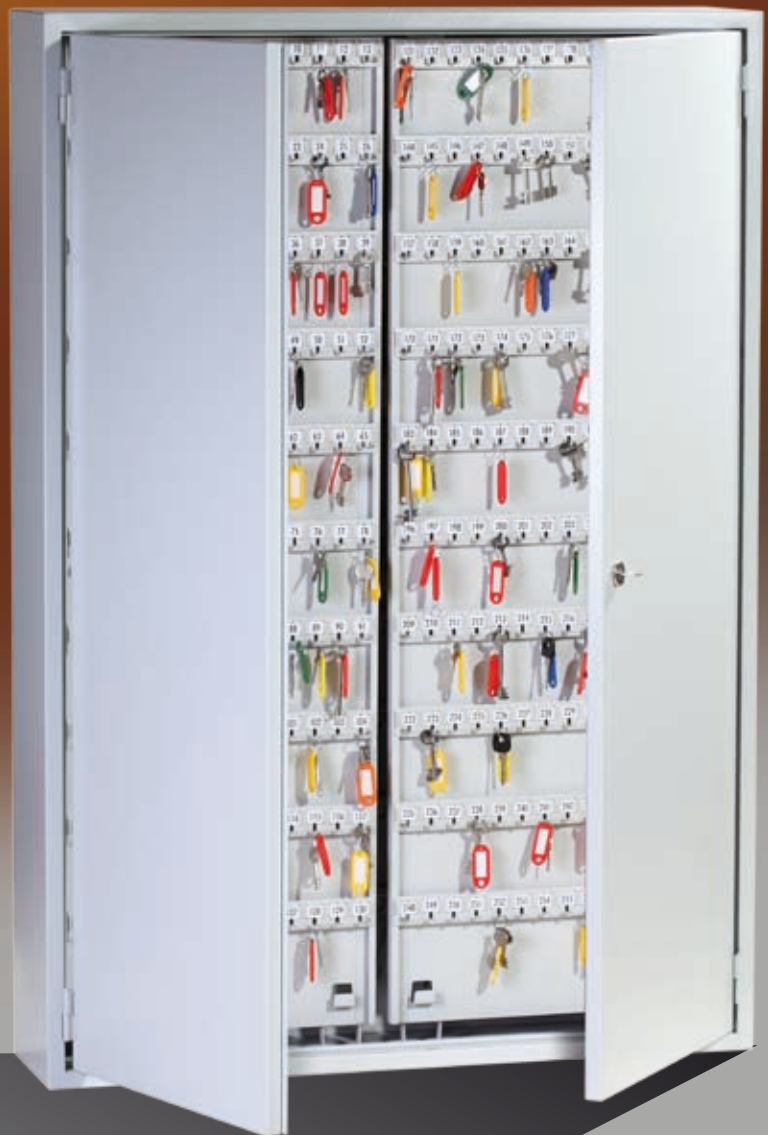
Abb.: GG 780

Schlüsselleiste verstellbar, mit stabilen Metallhaken