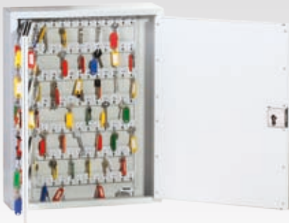
Abb.: M 250 mit Vorrichtung für Profilhalbzylinder