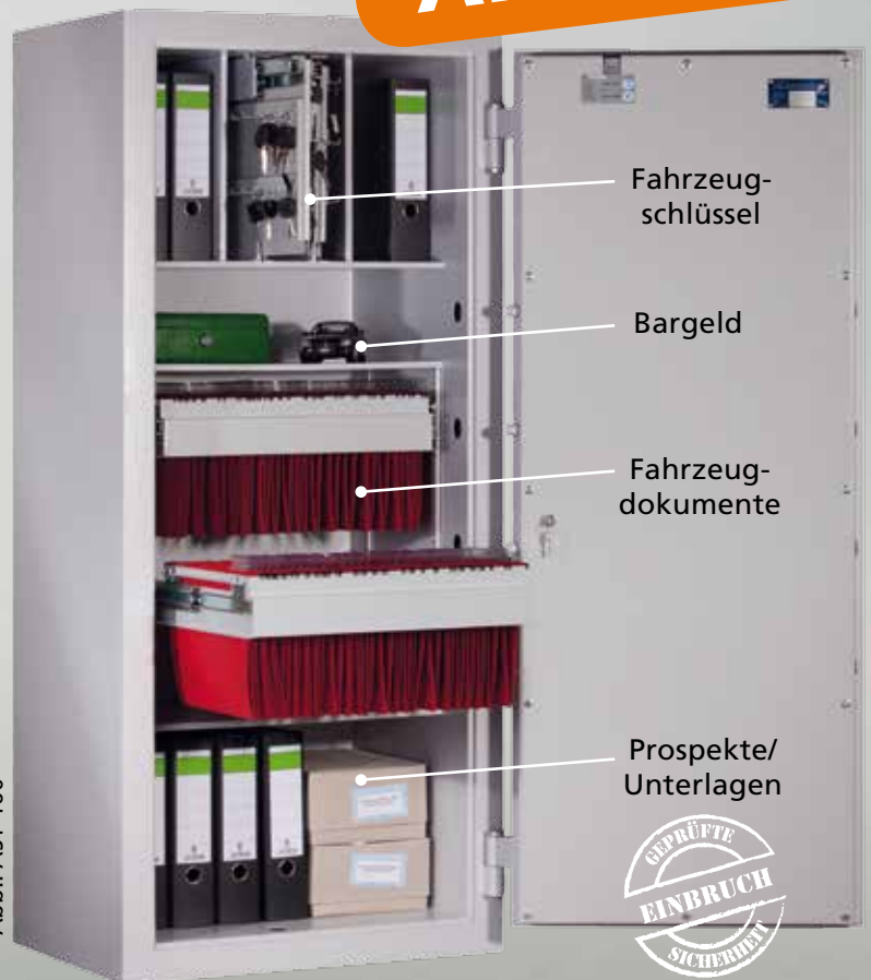
Abb.: AST 160

Für die Anordnung der Schlüssel nach Ihren Vorstellungen bieten wir entsprechende Hakenleisten mit unterschiedlicher Anzahl Haken sowie den verschiedenen Hakenabständen an (* Muster siehe oben).