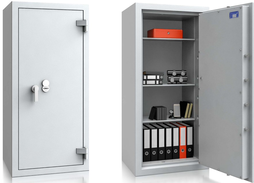
Modell EN I-160