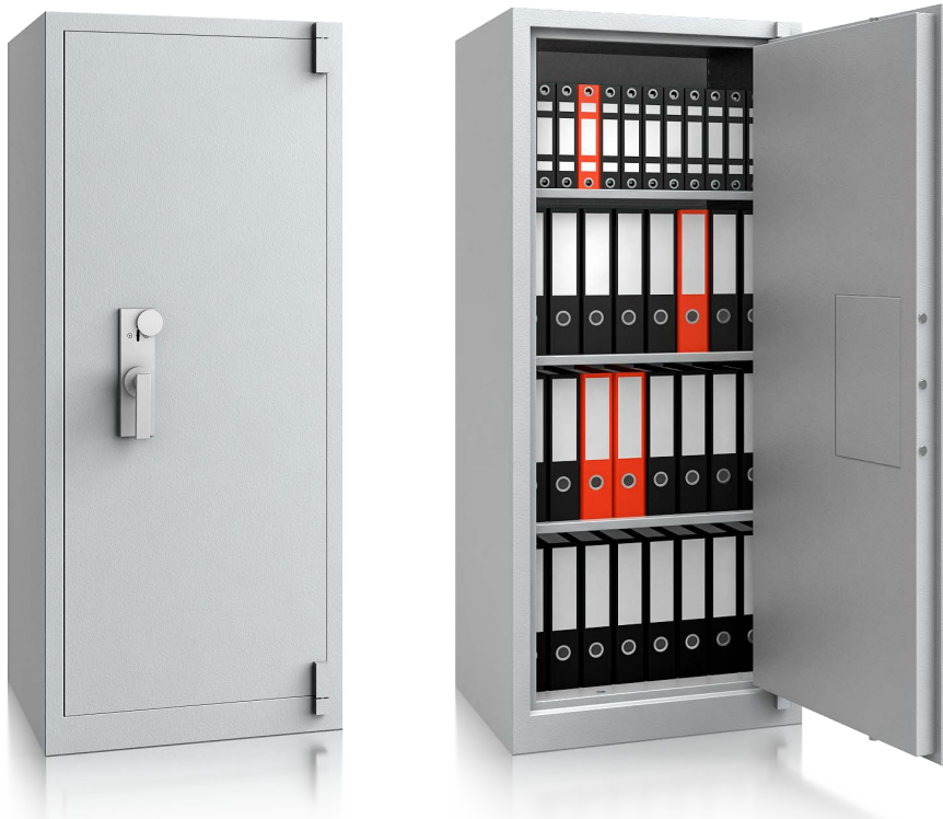
Modell BS 1000