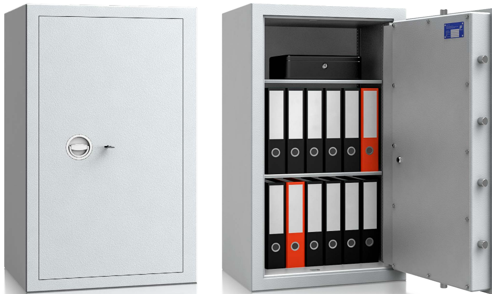
Modell MVO 10