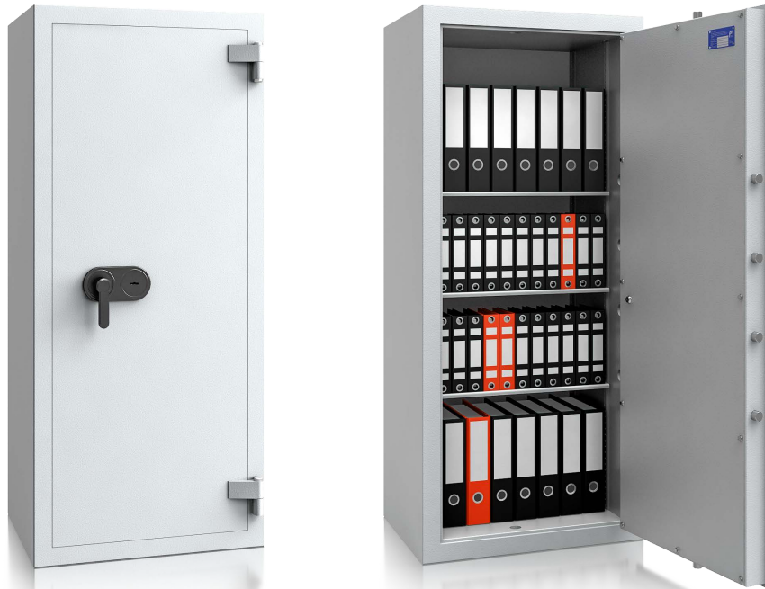
Modell EV 0-160