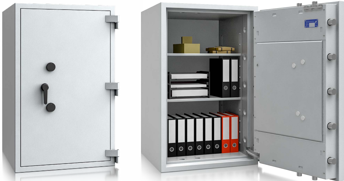
Modell EW V-124