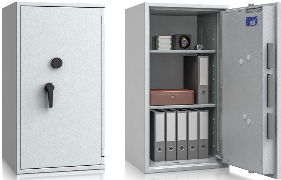
Modell EW III-105