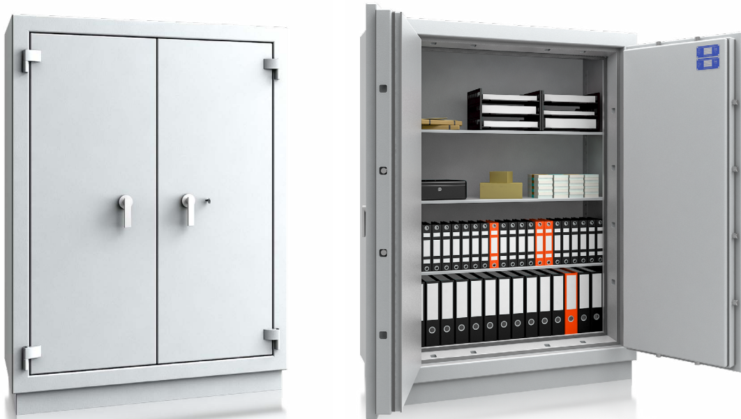
Modell PEB 1802/2