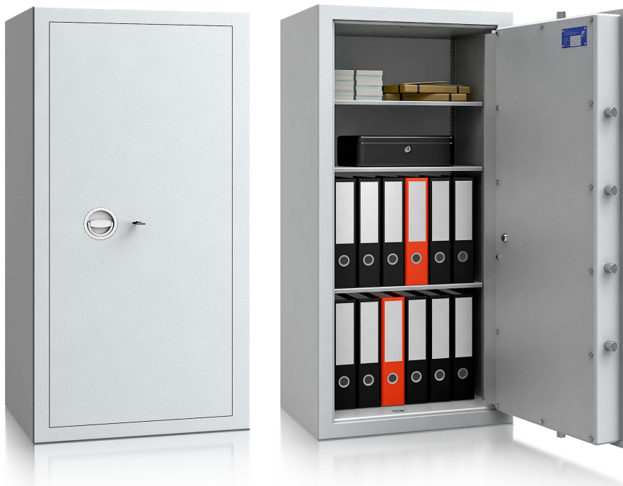
Modell MNO 12