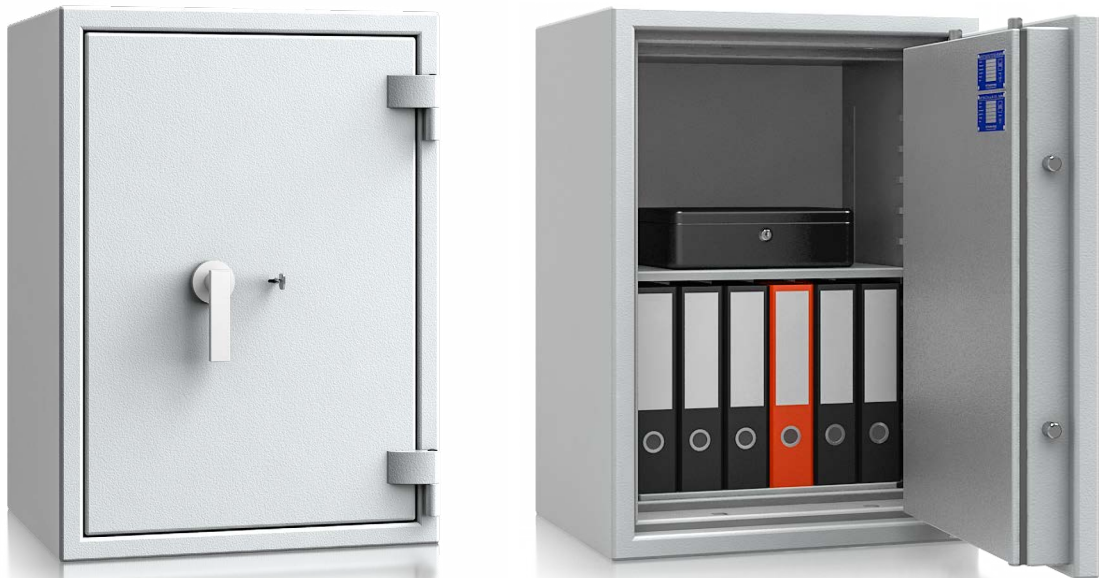
Modell PEV 82