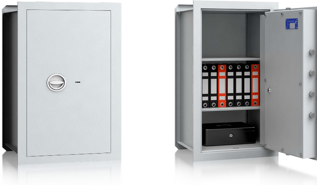
Modell VNO 8